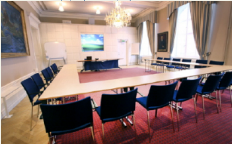
Norrbyalen på Ersta konferens

www.erstadiakoni.se/sv/konferenshotell/konferens